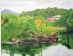
風景 F10 油彩