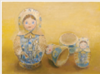
Матрёшка F4 アクリル