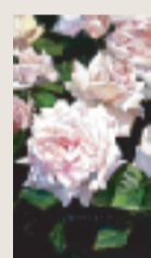
薔薇 M4 油彩