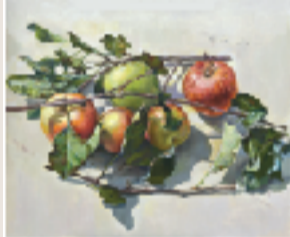
林檎 F10 油彩