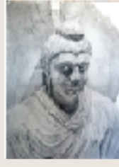
オリエントの仏像 F6 鉛筆