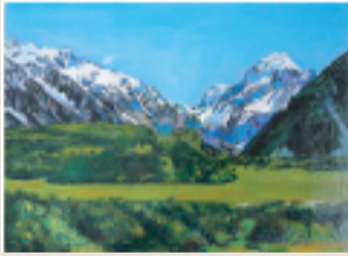
マウントクック F4 油彩