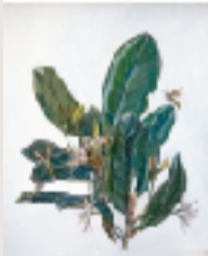
めひるぎの花 F6 油彩